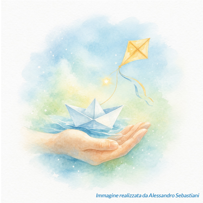
Immagine realizzata da Alessandro Sebastiani

“5° Giro d’Italia delle Cure Palliative Pediatriche”